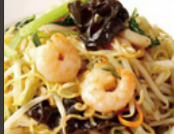
五目焼きそば 1,300円 (税込)