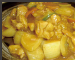
鶏肉カレーライス 1,200円 (税込)