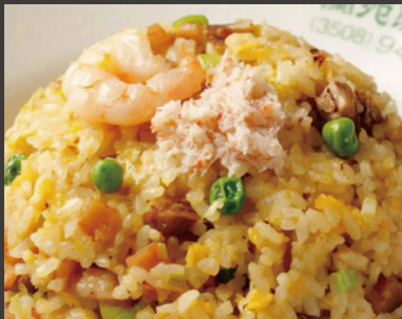
五目チャーハン 1,200円 (税込)

新橋で創業70年の 老舗中華料理店 「蘭苑飯店 本店」の味を 当施設でご賞味頂けます